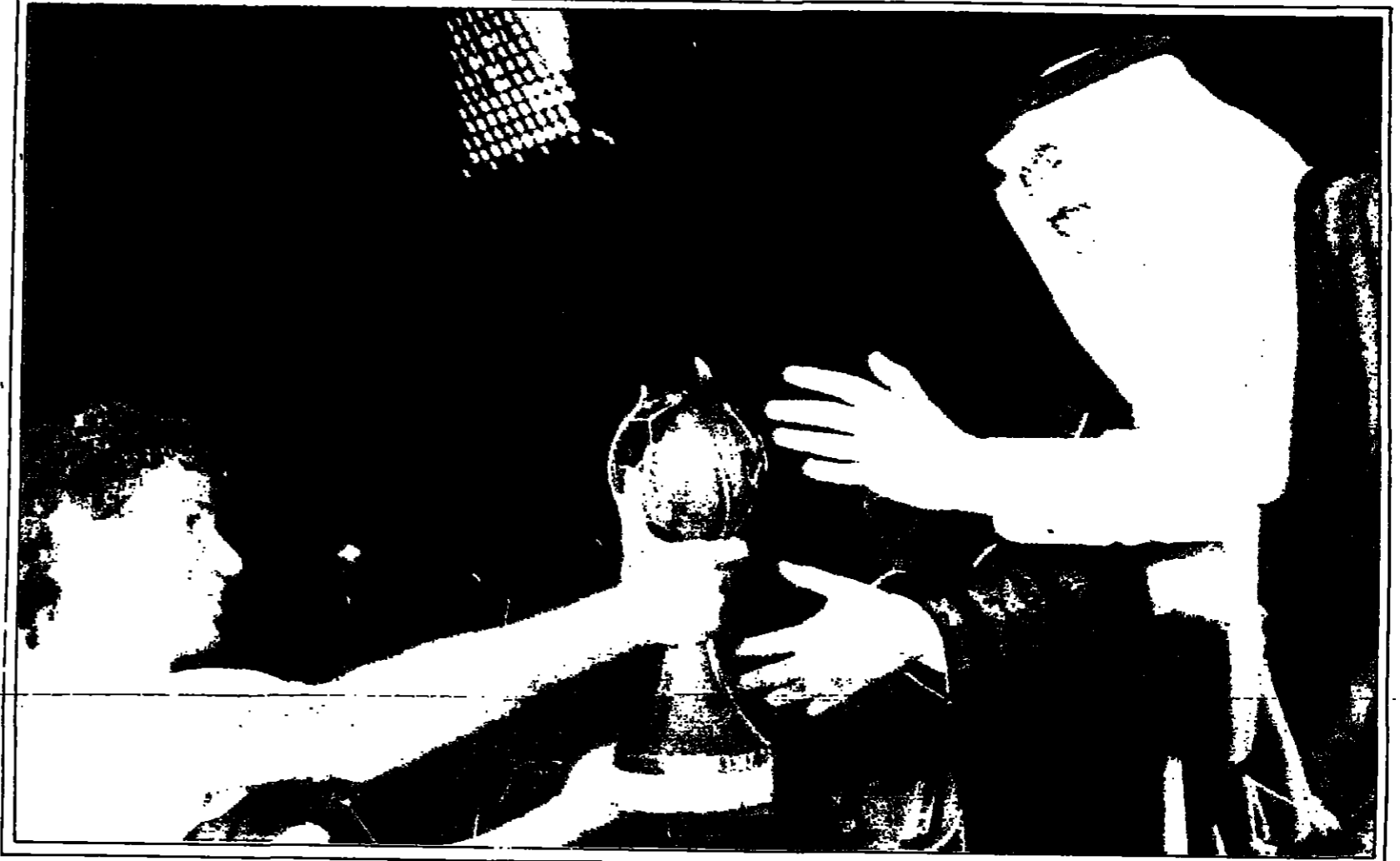
هذه هديتنا .. ثمرة دعم وتوجيه خادم الحرمين الشريفين وسمو نائبه وحصوله جهودكم يا أمير الشباب

جده من قبل صاحب السمو الملكي الأمير فيصل بن فهد بن عبدالعزيز الرئيس العام لرعاية الشباب وصاحب السمو الملكي الأمير سعود بن عبدالحسن نائب أمير منطقة مكة المكرمة وصاحب السمو الملكي الأمير خالد بن عبدالله بن عبدالعزيز وكيل الحرس الوطني بالمنطقة الغربية .. وحتى استقر الموكب في قلب الملعب الكبير وسط مشاعر الألاف من الجماهير .. العاشقة لهذا الوطن .. الفخورة بإنجاز أبناء الوطن .. المعترزة بكل ماتحقق ويحقق لهذا الوطن في ظل الرعاية الكريمة من قبل خادم الحرمين الشريفين يحفظه الله ويديم وجوده .. ● وهكذا .. تتواصل افراح هذا الوطن .. تتدفق حبا .. وولاء .. ووقاء .. وتضحية .. بعد ان كان العطاء .. رائعا .. و الوفاء .. كبيرا .. للوطن والولاء .. للقيادة .. الراشدة .. كان يوم أمس الأول يوم حب كبير .. ويوم عهد رائع .. ويوم تكريم لا يوصف .. عندما التقى الأبطال بالرجل الإنسان .. بالقلب الكبير .. بصاحب السمو الملكي الأمير عبدالله بن عبدالعزيز نائب خادم الحرمين الشريفين وسمو ولي العهد .. ورئيس الحرس الوطني في منزل سموه .. فاستمعوا منه الى مشاعر الاب .. وتطلعات القيادة .. وأمال الوطن في المزيد من العطاء والتفوق .. لابناء هذا الوطن .. ● وقبلها .. كانت المملكة تتابع من وراء الشاشة البيضاء النقل الحي على الهواء .. لاعيد عروس البحر الاحمر .. منذ لحظة اللقاء .. منذ الاستقبال الحافل للابطال في مطار